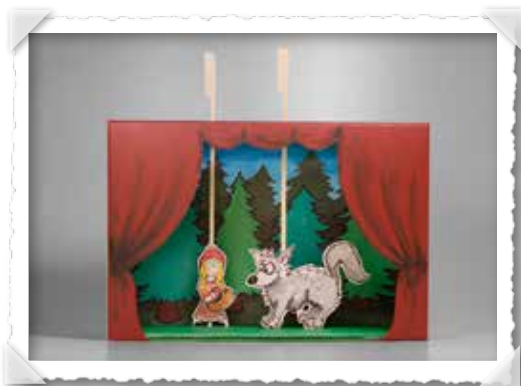
Vorhang auf für das selbst gebastelte Theater!